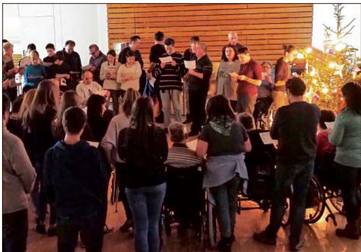
Ils giuvenils han delectau lur hosps cun cant e musica.